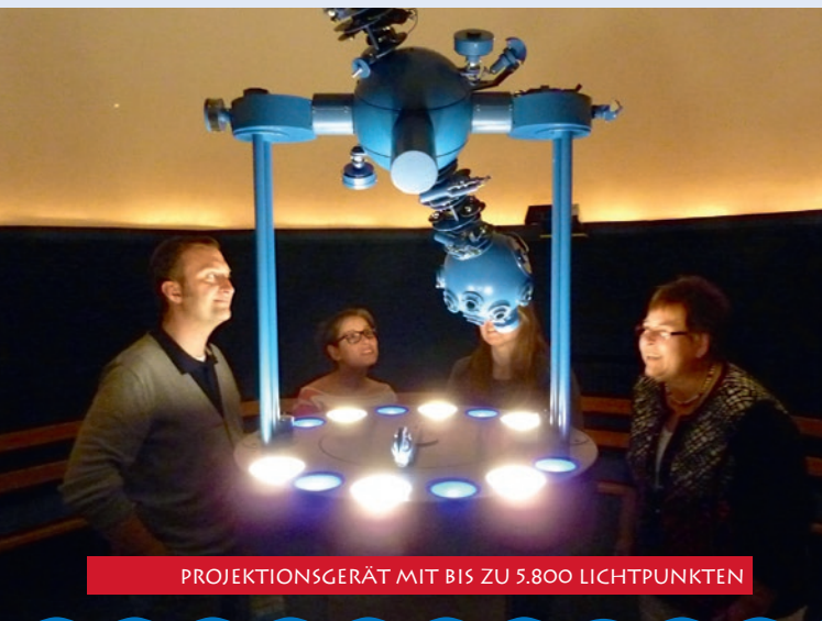
PROJEKTIONSGERÄT MIT BIS ZU 5.800 LICHTPUNKTEN